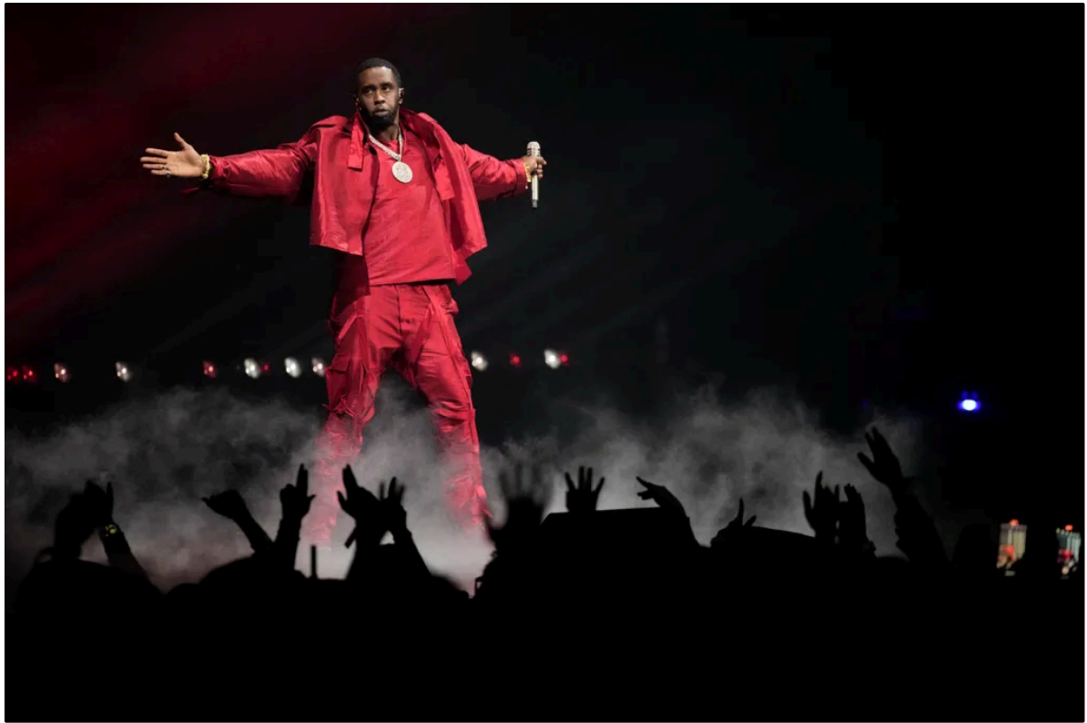
Hip-Hop-Star Combs 2023: »Er gehört zu einem Typus Mann, der glaubt, alles machen zu dürfen«

SPIEGEL: Aktuell wird Combs sexuelle Gewalt in mehreren Fällen vorgeworfen. Unter anderem soll er 2003 mit zwei anderen Männern eine 17-Jährige vergewaltigt haben. Wie erklären Sie es sich, dass mutmaßliche Opfer sich erst jetzt wehren und Anzeige erstattet haben?