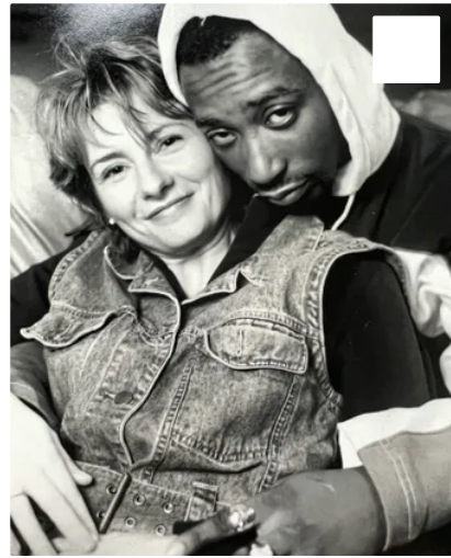
Ries 1997 mit Rapper Ol' Dirty Bastard vom Wu-Tang Clan: »Zwei Engländerinnen sollten seine alten Klamotten bügeln«

SPIEGEL: Wo haben Sie ihn kennengelernt?