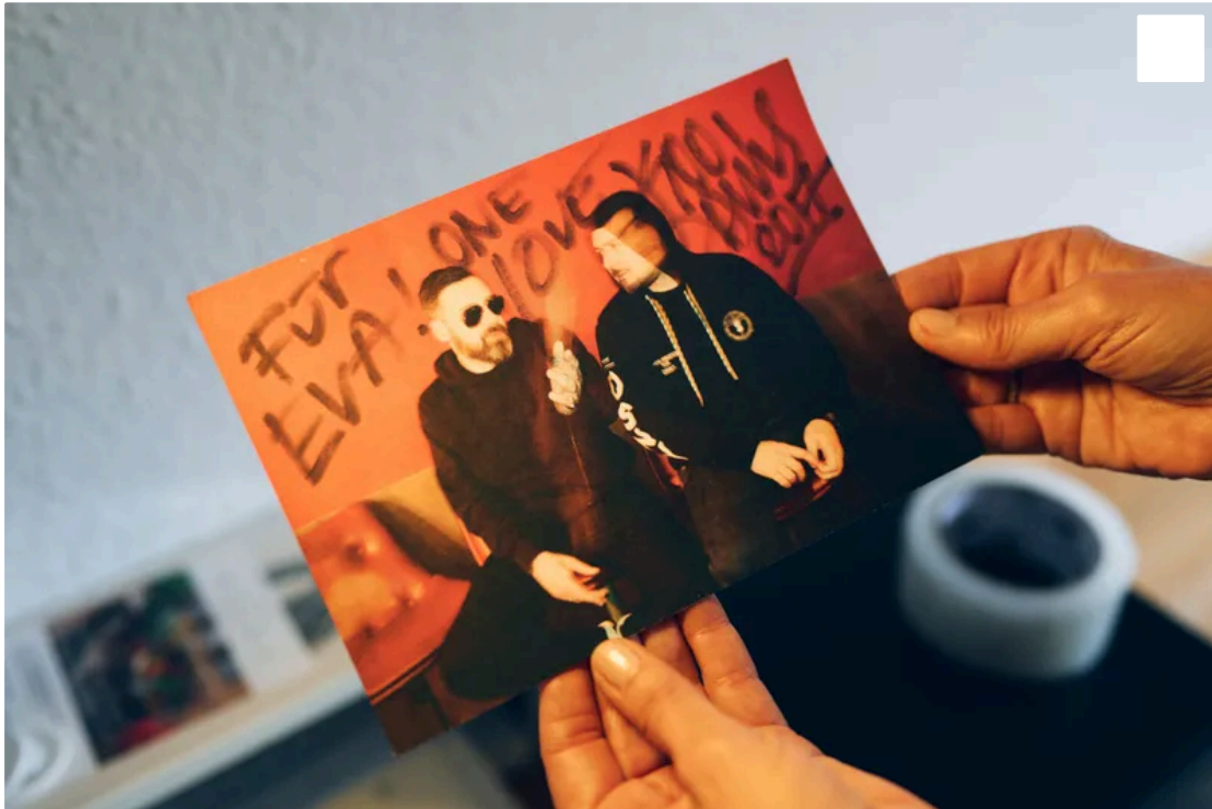
Karte der deutschen Rapper Kool Savas und Sido: Mit freundlichen Grüßen aus der deutschen Szene