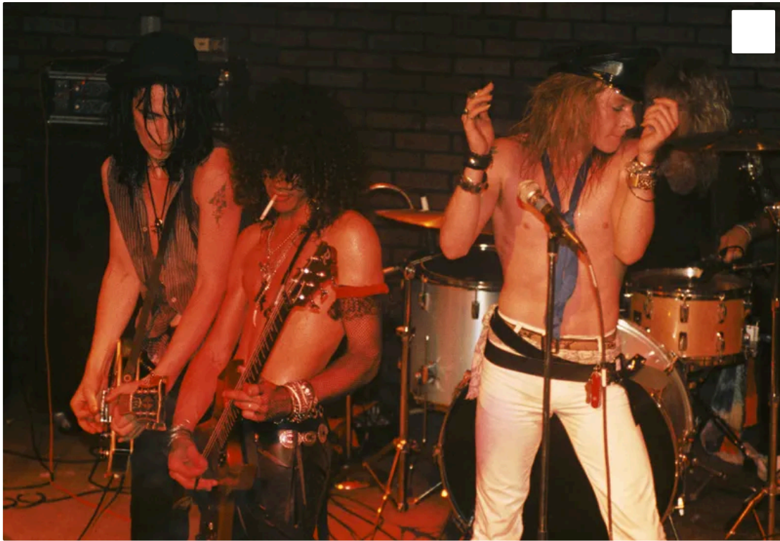
Band Guns N' Roses 1985: »Im Hardrock gibt es den gleichen Männlichkeitskult«

SPIEGEL: Der Fall P. Diddy zeigt also kein Hip-Hop-spezifisches Problem auf?